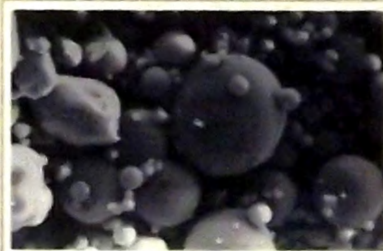
フライアッシュの粒子

フライアッシュは、レンガの原料(粘土)と同様のシリカ・アルミナを主成分とする原料です