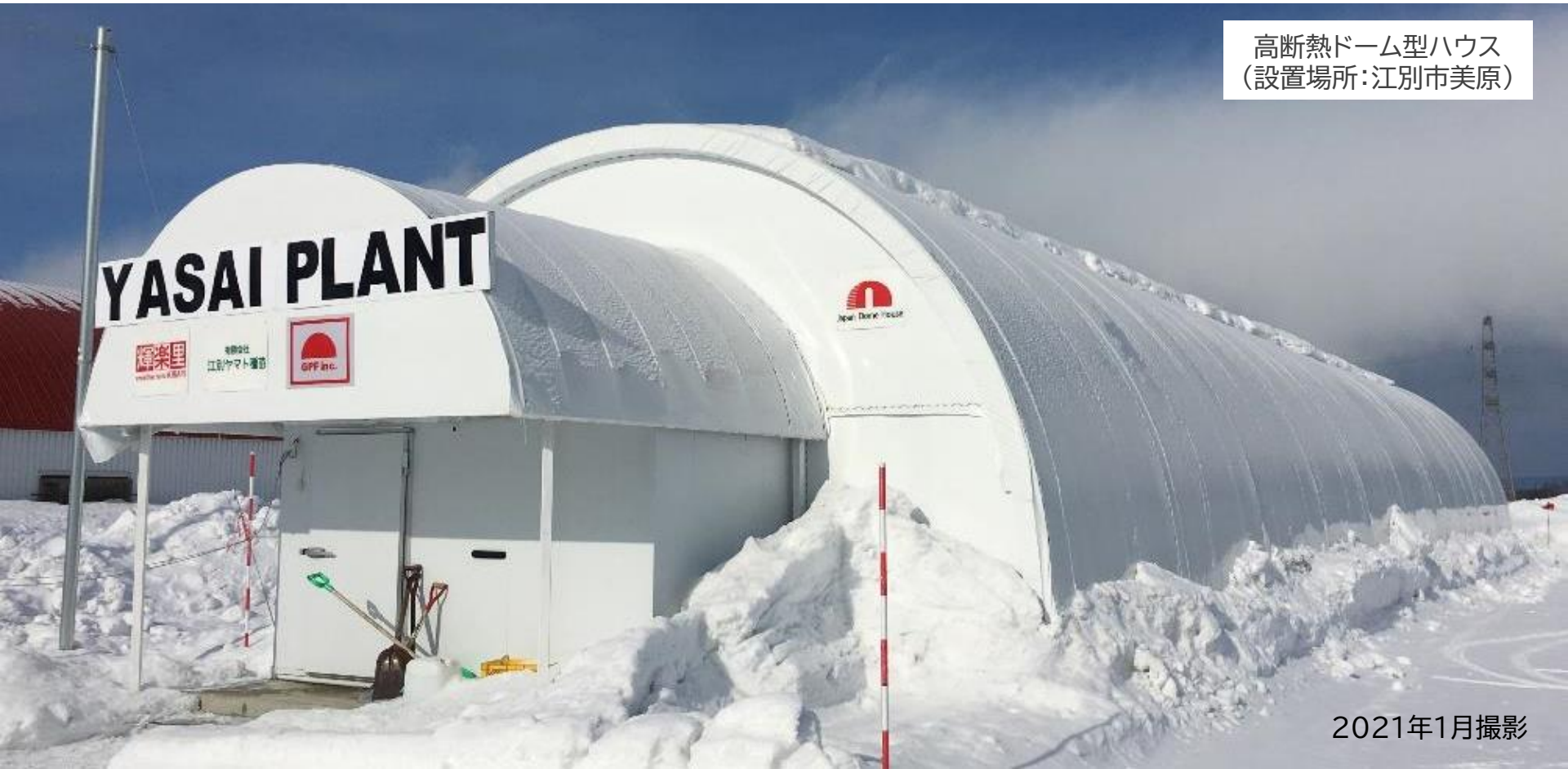
高断熱ドーム型ハウス (設置場所:江別市美原)