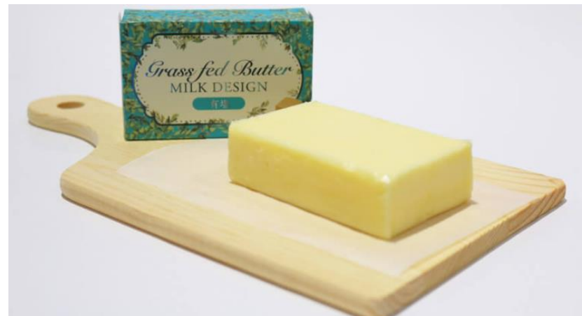
グラスフェッドミルクとバター